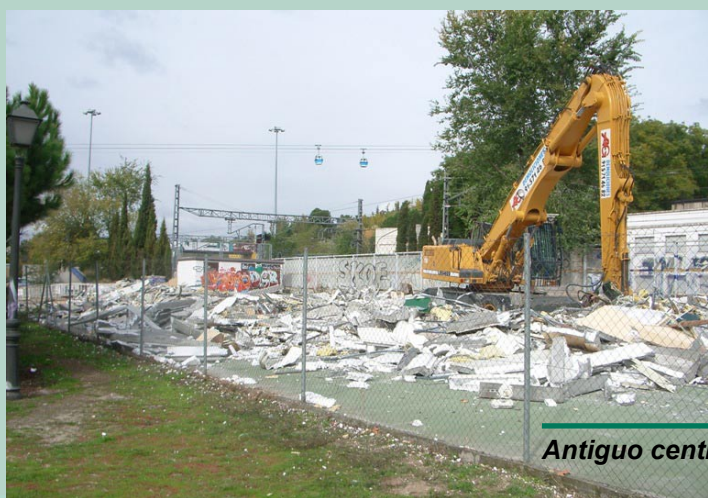
Antiguo centro de salud.

Como se puede apreciar en las imágenes que ofrecemos, por fin el edificio se ha desmantelado. Estamos muy satisfechos de que la persistencia de las gestiones llevadas a cabo por la Asociación hayan dado sus frutos. Hubiese sido preferible que esta situación la realizara la Administración, en el tiempo y forma que correspondía, sin tenerse que haberse producido una alarma social en el barrio totalmente innecesaria. Llegados a este punto, y siguiendo con el razonamiento anterior, nos gustaría que en tiempo razonable y forma adecuada, se tratase definitivamente esta Zona Verde.