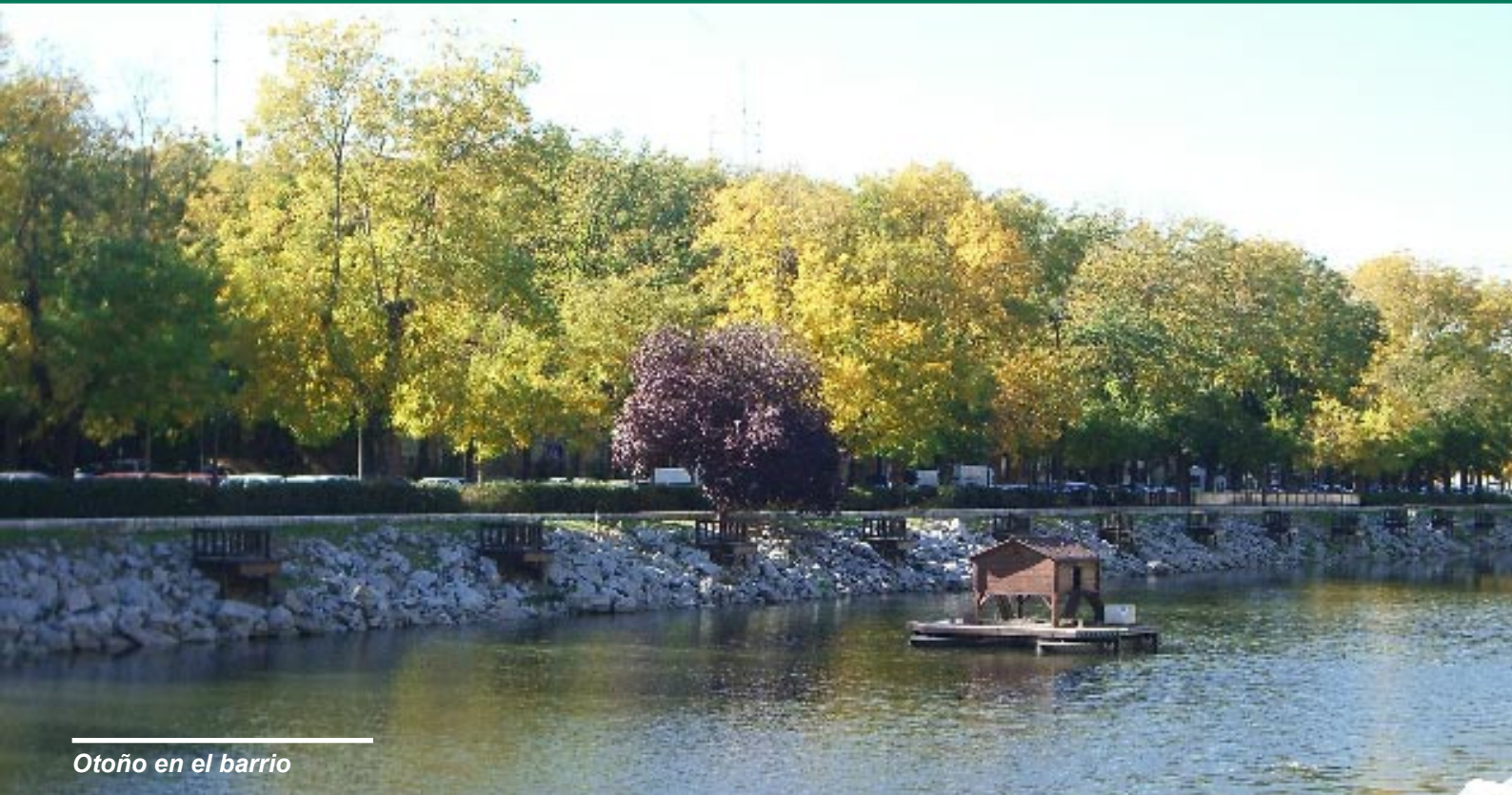
Otoño en el barrio

Edita: Asociación de Vecinos Manzanares-Casa de Campo. Local Social: c/ Bahía nº 39 (Puerta Roja) e-mail: av.manzanares@gmail.com ; página web: www.manzanares.org