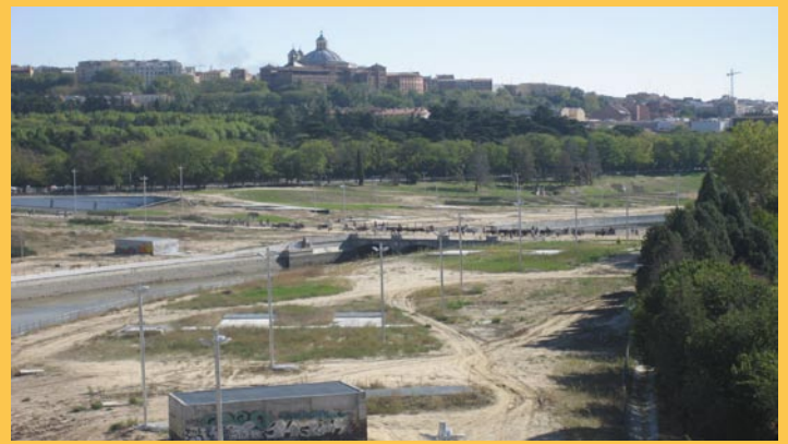
Los rebaños de vacas (derecha) y ovejas (izquierda) atravesando el Puente del Rey

En esta Fiesta, además de recordar la protección y restauración de las vías pecuarias también se intenta dar a conocer y favorecer la protección de las razas autóctonas de la Península Ibérica, es decir propias de los distintos territorios de nuestro país. En concreto este año han recorrido las calles de Madrid las siguientes razas: ovejas rubias de Colmenar Viejo, vacas de la raza Tudanca (Cantabria) y negras sarranas de Quintanar de la Sierra (Burgos), bueyes y burros de Zamora y León. Todas estas razas y muchas más conforman el patrimonio pecuario de nuestro país, teniendo además un