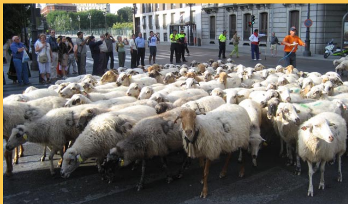
Fiesta de la Trashumancia 2008

El día 26 de octubre los rebaños de razas autóctonas volvieron a recorrer Madrid, partiendo de la Casa de Campo y regresando a ella después de discurrir por distintas calles y plazas del centro de la ciudad. Muchos de estos itinerarios que recorren constituyen vías pecuarias (cañadas, cordeles,