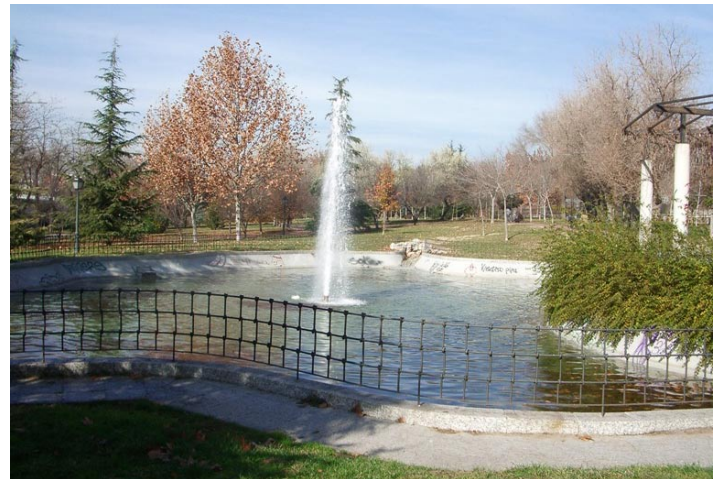
Parque de la Bombilla.

Debido al grado de protección que goza el Parque del Oeste, que está incluido en el Catálogo de Parques